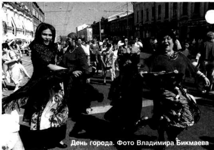
День города.