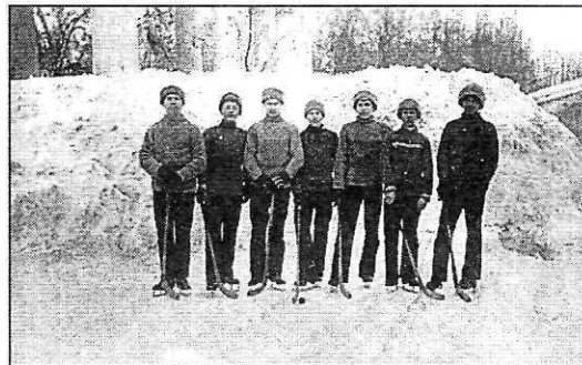
Пермские хоккеисты 1916 г.