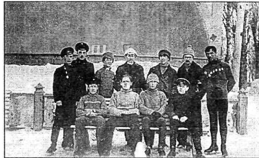
Состязания на коньках 1916 г.

Любители спорта в Перми не унывали. 28 февраля 1915 г. на заснеженном катке со-